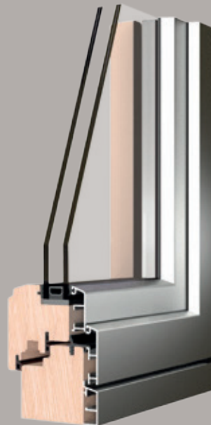
System 5000/S Quadra modernes Design mit rechteckiger Linienführung

Das System 5000/S Quadra zeigt sich im modernen Design mit rechteckiger Linienführung und steht ganz in der Tradition klassischer Fenster. Das Angebot an Profilen ist sehr breit und in der Lage, alle baulichen Anforderungen zu erfüllen. Im System 5000/S Quadra kann die Serie von Zubehörteilen und Dichtungen eingesetzt werden, die eine schraubenlose Montage des Aluminiumrahmens auf das Holz ermöglicht. Dadurch werden Fehler bei der Positionierung der Clips vermieden und viel Zeit gespart.